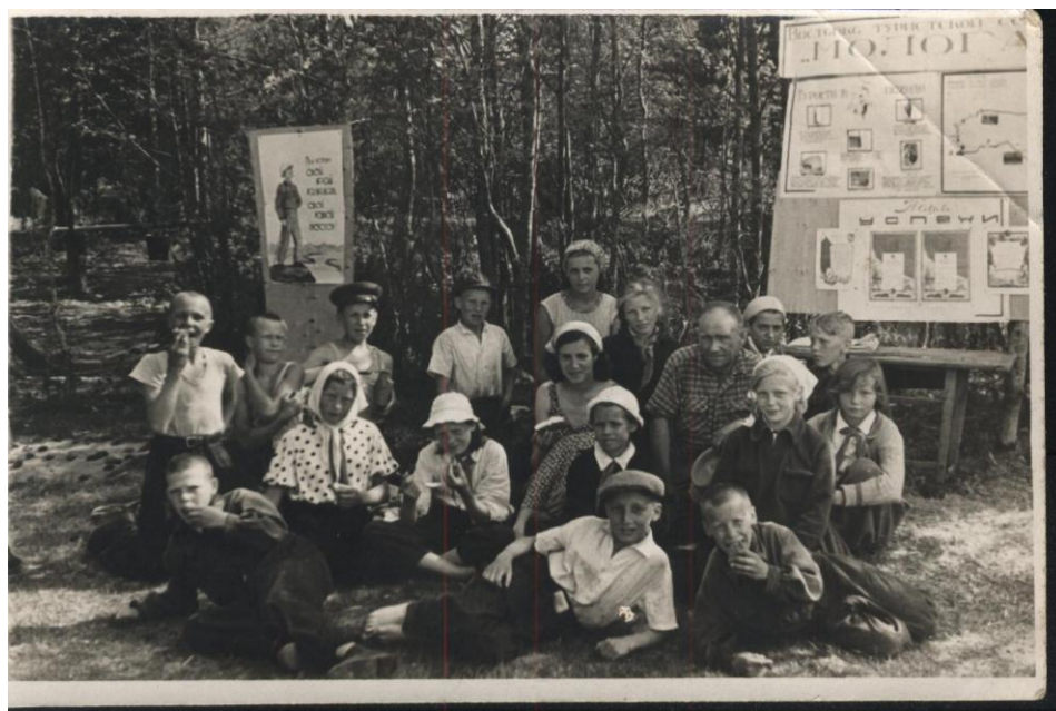
Турпоход Весьегонск 1959г.

На летних и зимних каникулах отец с учащимися школы много путешествовали по нашему краю пешком, по Весьегонскому району, Рыбинскому водохранилищу на пароходе, по Прибалтике аж на грузовых машинах.